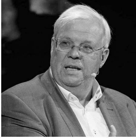
Christian Wehrschütz / ORF Auslandskorrespondent Thema: Das Ende der (Medien)Realität